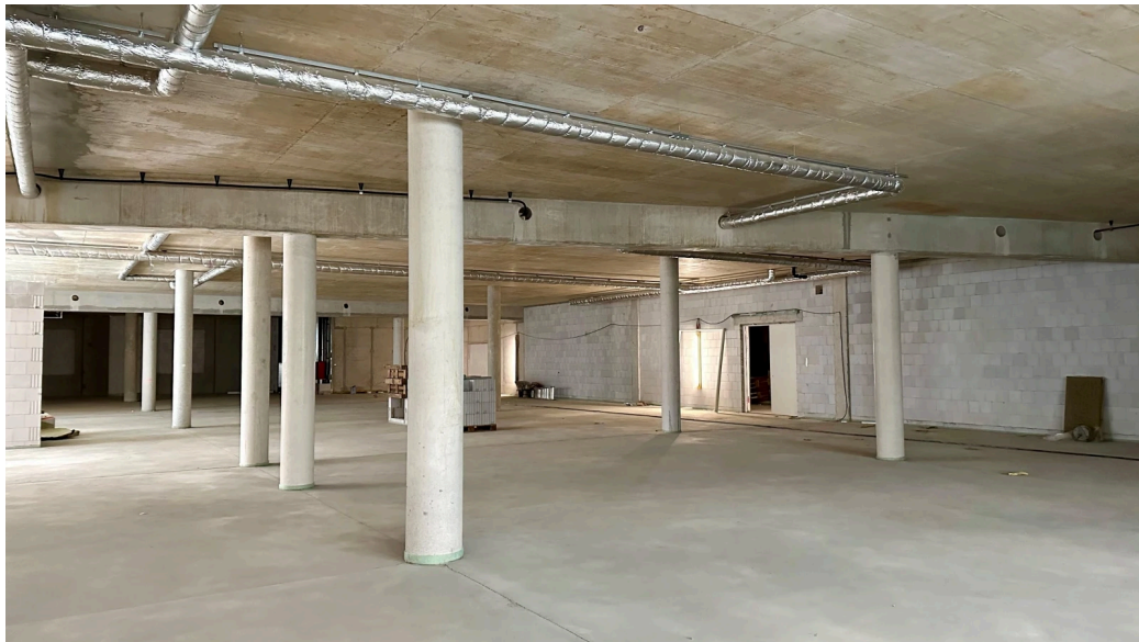
Die Ladenfläche des Non-Food-Händlers „Action“, Ankermieter im neuen Rathaus in Schwelm.