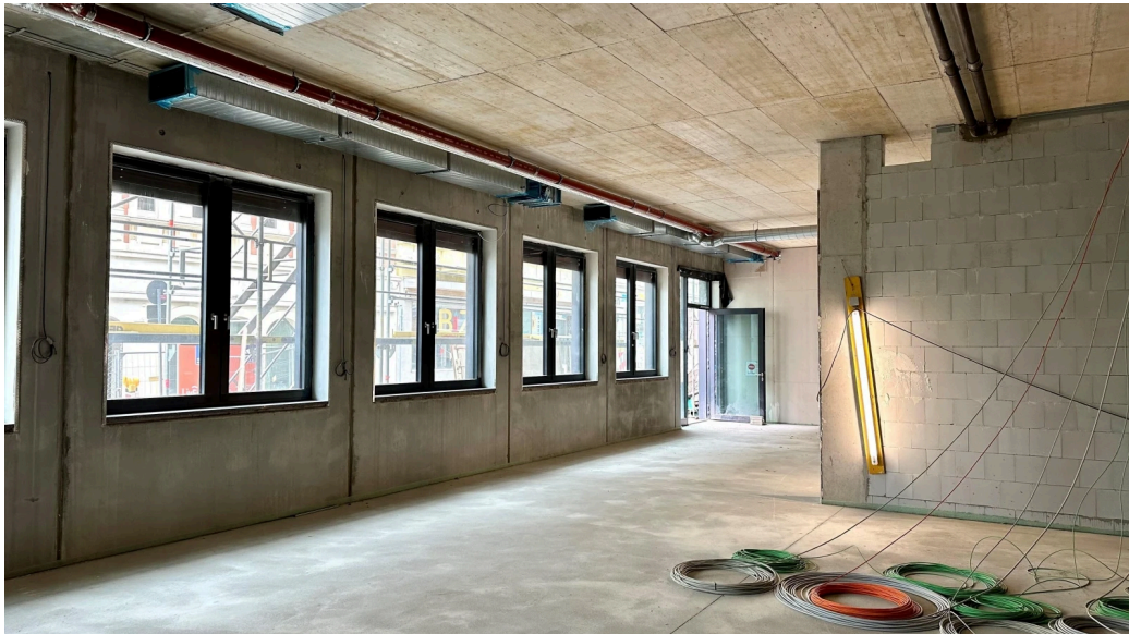
Der künftige Eingangsbereich von „Action“, zugänglich von der Straße Neumarkt in Schwelm. Hier wird noch eine Schiebetür eingebaut.