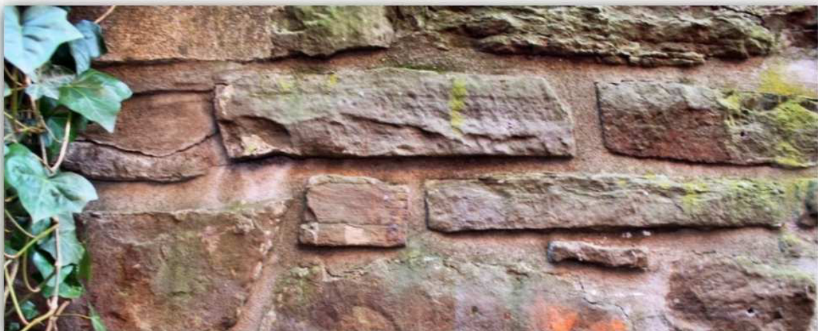
Schwelm, Brauereigasse | Stadtmauer

Die Arbeitsgruppe „Stadtattraktivität“ der Gesellschaft für Stadtmarketing und Wirtschaftsförderung Schwelm (GSWS) hat deshalb in Zusammenarbeit mit der Stadt Schwelm und der Erfurt-Stiftung einen schmucken und intelligenten Flyer für den historischen Stadtrundgang im Westentaschenformat aufgelegt. Hiermit wird das touristische Angebot unserer Stadt erweitert und ist eine weitere Informationsquelle für unsere neuen Mitbürger.