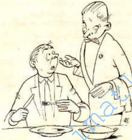
„Entschuldigense. Aber Filzgerichte muß ich im Voraus kasieren.“

In diesem Augenblick werden meine Betrachtungen über die Einflußmöglichkeiten ehedraulicher Beobachtungsgabe durch einen bärbeißig dreinblickenden Herrn jäh unterbrochen: „Stoah hier nich rüm!“ fletscht er mich an, „pack leiwer met aan!“ . . . Nun, und seit der Zeit übe ich mich auf dem Nachbarschaftsgelände in berufsfremden Tätigkeiten und sehe schwarz für meine Karriere als Reporter.